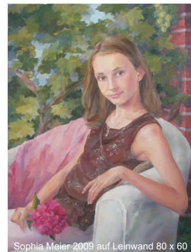
Sophia Meier 2009 auf Leinwand 80 x 60