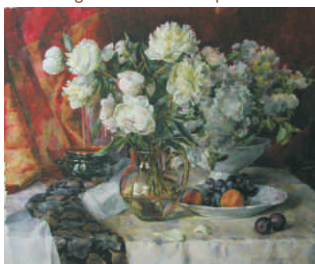
Pfingstrosen 2004 Aquarell 70x55

Kontakt: Edmond's - Literaturcafé Hexenhaus, Poetenweg 88, 14612 Falkensee, Telefon: 03322-123 697, www.hexenhaus-falkensee.de