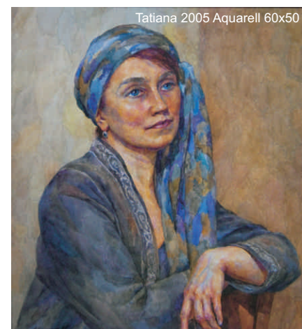
Tatiana 2005 Aquarell 60x50