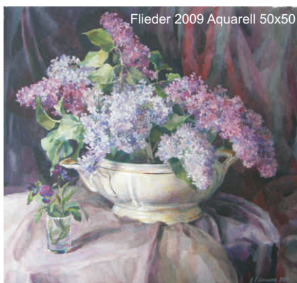
Flieder 2009 Aquarell 50x50